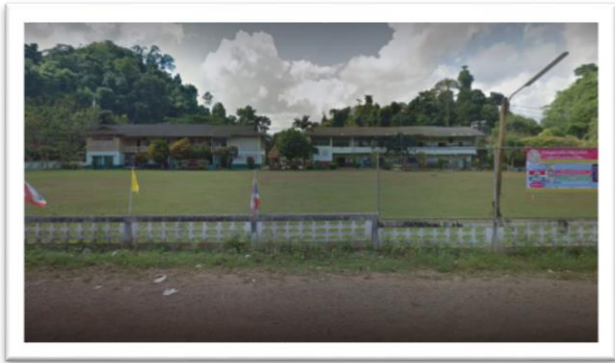
☛ โรงเรียนชุมชนบ้านถ้ำสิงห์