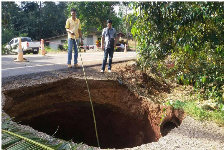
- บริเวณริมถนนซอยผวนอุปลัมภ์ ๗ หมู่ที่ ๑